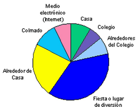
Gráfico de porcentaje de estudiantes por lugar en que le ofrecieron alguna droga ilícita (tales como crack, cocaína, éxtasis, etc.) por última vez