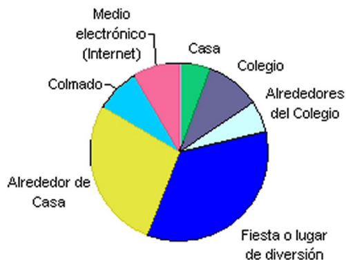
Gráfico de porcentaje de estudiantes por lugar en que le ofrecieron Marihuana por última vez